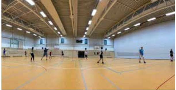
Beste Badminton-Bedingungen für Spiel und Liga.

Die Badmintonabteilung ist eine lebendige und aktive Gruppe von begeisterten Spielern jeden Alters und Könnens. Der Spaß am Spiel und die Gemeinschaft stehen bei uns im Vordergrund. Eventuell bietet sich demnächst sogar die Möglichkeit, mit einer Hobby Mannschaft wieder in den Ligabetrieb einzusteigen. Wir freuen uns immer über neue Mitglieder, die Lust haben, Badminton zu spielen und Teil unserer tollen Gemeinschaft zu werden. Egal ob Anfänger(in) oder Fortgeschrittene(r), bei uns sind alle herzlich willkommen. Kommt vorbei und schnuppert einfach mal rein – wir freuen uns auf Euch!