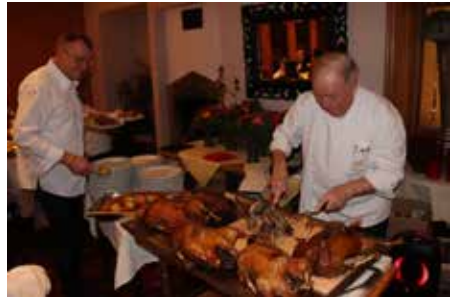
Die Zerlegung der Gänse