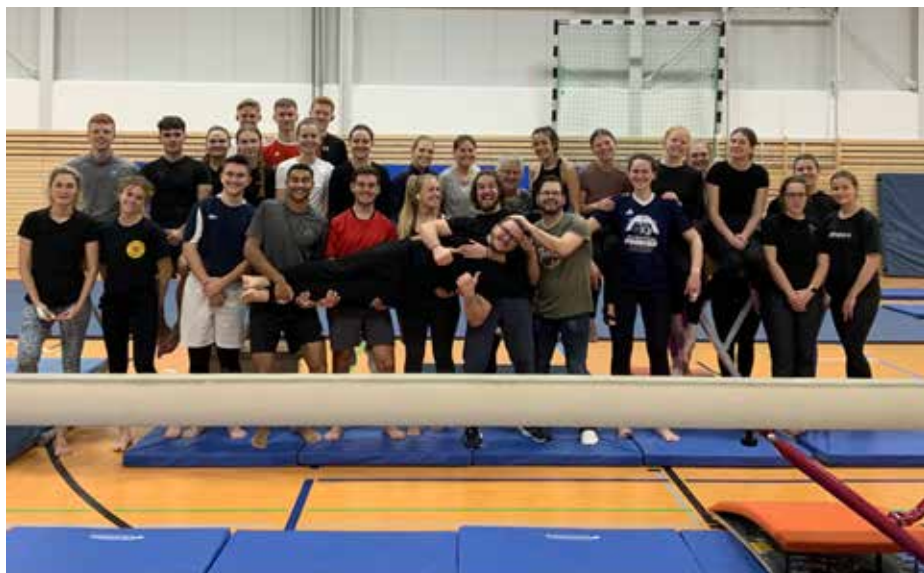
Der Studenten-Trupp vor dem gefürchteten, aber bezwungenen Schwebebalken

Kopf. Denn ist es manchmal auch die fehlende Kraft oder Koordination, die einem den kleinen persönlichen Erfolg verwehrt, so ist es in den meisten Fällen eher Angst, Schreck und Nervosität, Anspannung und Blockieren.