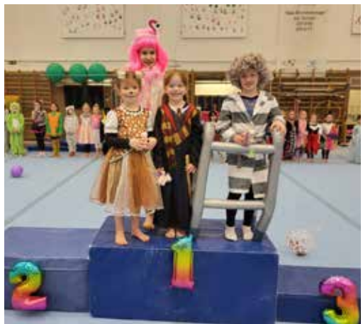
Die ersten Wettkämpfe sind dann der Pippi-Langstrumpf-Pokal um Karneval herum und der Naschörnchen-Pokal vor Ostern.

Denn das prestigeträchtige Prädikat „Turntalentschule“ (TTS) ist gebunden an anspruchsvolle Vorgaben zur Kompetenz der Trainer/innen, den Kaderstatus von Turnerinnen, die Trainingshäufigkeit und die Hallenausstattung.